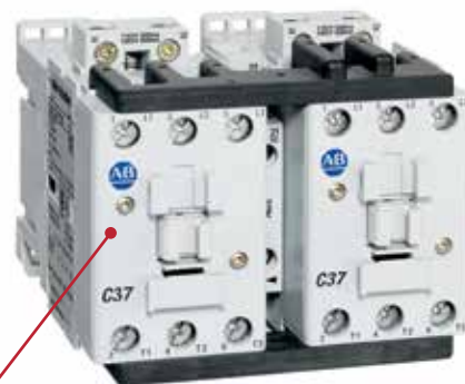
Contactor IEC inversor 104-C

La nueva bobina 24 VCC reduce el tiempo de desactivación a 18-23 ms