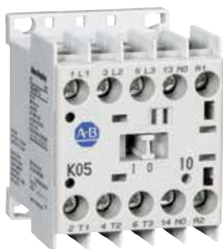
Contactor IEC 100-K

Los contactores en miniatura Boletín 100-K están diseñados para aplicaciones comerciales e industriales ligeras en las que el espacio de panel es limitado. Estos dispositivos en miniatura, aunque de 45 mm de ancho, son más planos y tienen menos requisitos de profundidad de panel que los contactores IEC estándar.